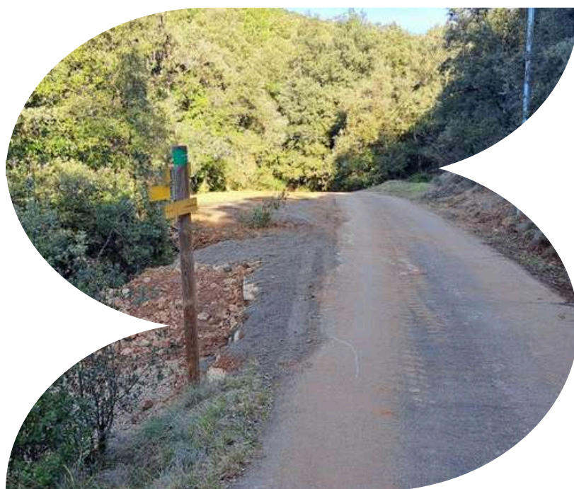
Aire de croisement route de Mercoirol