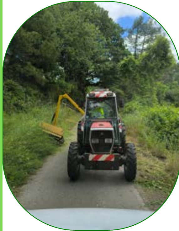
Débroussaillage des chemins communaux