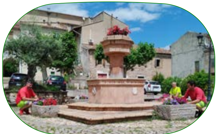
Fleurissement de la place de la Mairie