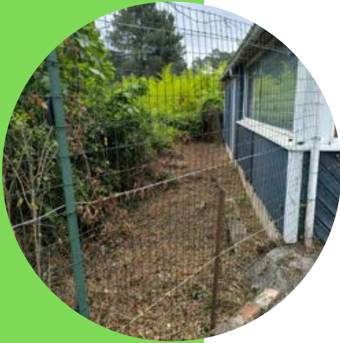
Nettoyage des abords de la PMI